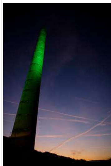
Lire l'édito :: Construisez votre mini minaret